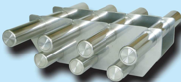
SMKK-2 型 [Φ25(7本) / □235用]