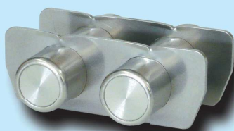
SMKM-3 型 [Φ25(2本) / Φ100用]