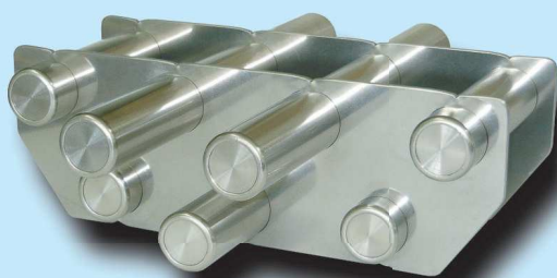
SMKM-1 型 [Φ25(7本) / Φ235用]

マグネットバーを○格子状・□格子状に組み合わせた格子形マグネットです。 磁石の力でペレットや粉碎物内の鉄片鉄粉等の異物を除去。様々な用途に対応しています。